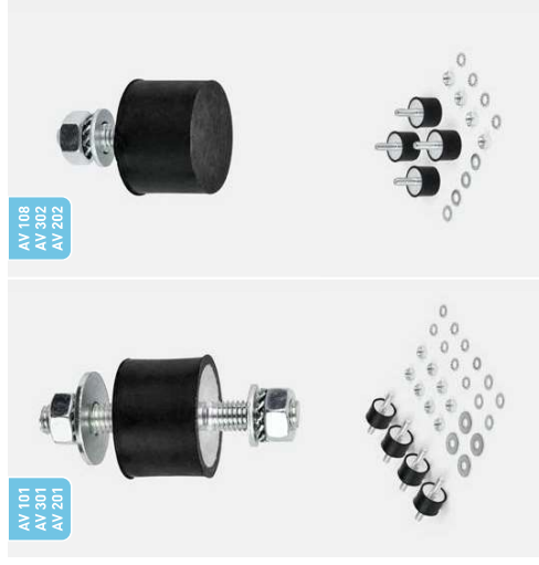
AV 101 AV 301 AV 201