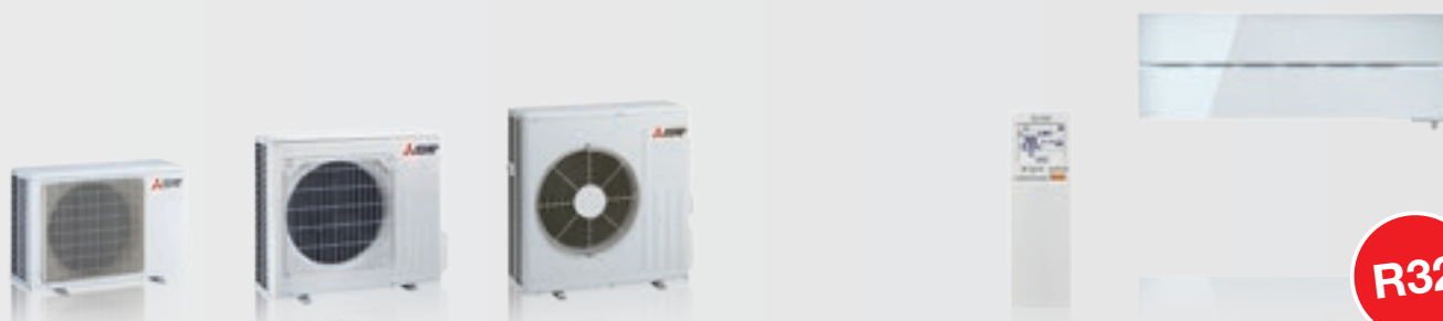
MUZ-LN25 / 35VG2